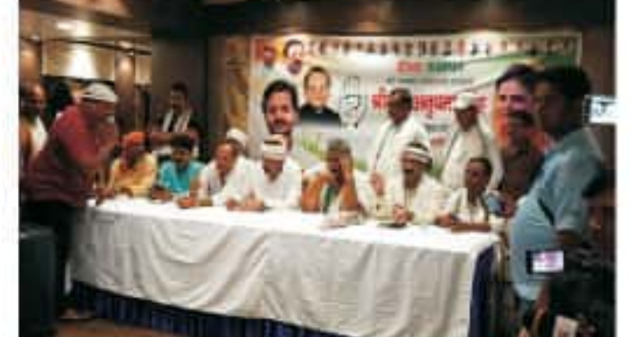
دھندا 7 مئی (نمائندہ): دھندا کے کانگریس امیدوارانوپمانگھ کی حمایت میں مہم چلانے کے لیے سابق ایم پی پیویادوکانگریس امیدوارانوپمانگھ نے دھندا پہنچے۔ انہوں نے پریس کانفرنس سے خطاب کیا اور امیدوارانوپمانگھ کی حمایت میں مہم چلانے کے لیے دعا گوئی کی۔ انہوں نے کہا کہ انہیں اپنی حکومت کے لیے کام کرنا ہے اور انہیں اپنی حکومت سے کھینچنے کے لیے دعا گوئی کی۔ انہوں نے کہا کہ انہیں اپنی حکومت سے کھینچنے کے لیے دعا گوئی کی۔ انہوں نے کہا کہ انہیں اپنی حکومت سے کھینچنے کے لیے دعا گوئی کی۔

انہوں نے کہا کہ انہیں اپنی حکومت سے کھینچنے کے لیے دعا گوئی کی۔ انہوں نے کہا کہ انہیں اپنی حکومت سے کھینچنے کے لیے دعا گوئی کی۔ انہوں نے کہا کہ انہیں اپنی حکومت سے کھینچنے کے لیے دعا گوئی کی۔ انہوں نے کہا کہ انہیں اپنی حکومت سے کھینچنے کے لیے دعا گوئی کی۔ انہوں نے کہا کہ انہیں اپنی حکومت سے کھینچنے کے لیے دعا گوئی کی۔ انہوں نے کہا کہ انہیں اپنی حکومت سے کھینچنے کے لیے دعا گوئی کی۔ انہوں نے کہا کہ انہیں اپنی حکومت سے کھینچنے کے لیے دعا گوئی کی۔