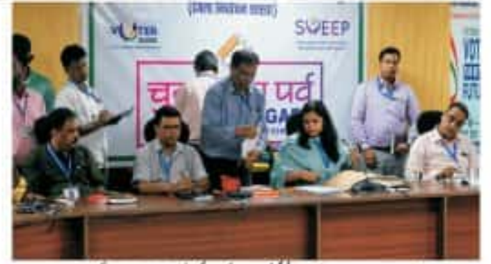
دھندا 7 مئی (نمائندہ): ڈسٹرکٹ الیکشن آفیسر نے امیدوارانہ کاغذات نامزدگی کے لیے موصول ہونے والے تمام 28 امیدواروں کی جانچ پڑتال اور شری ویرا لال سنگھ اور شری نارائن گری اور شری گوتم...

کاغذات نامزدگی واپس لینے کی آخری تاریخ 9 مئی ہے