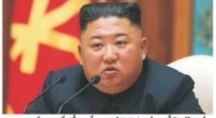
شمالی کوریا کے لیڈر کم جونگ ان کی سالگرہ پر عوامی حلف برداری کی تقریب کی تصویر

حماس کے رد عمل پر بات کر رہے رفح آپریشن کی حمایت نہیں کریں گے: امریکہ۔ حماس کے رد عمل پر بات کر رہے رفح آپریشن کی حمایت نہیں کریں گے: امریکہ۔ حماس کے رد عمل پر بات کر رہے رفح آپریشن کی حمایت نہیں کریں گے: امریکہ۔